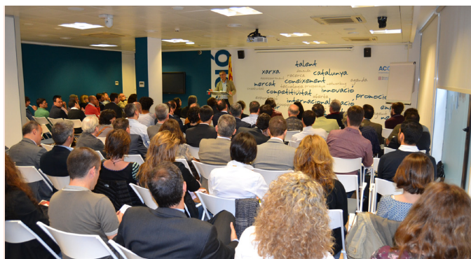
Esmorzar de finançament d'ACCIÓ.