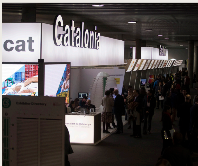
Estand de la Generalitat de Catalunya al Mobile World Congress, 2018.