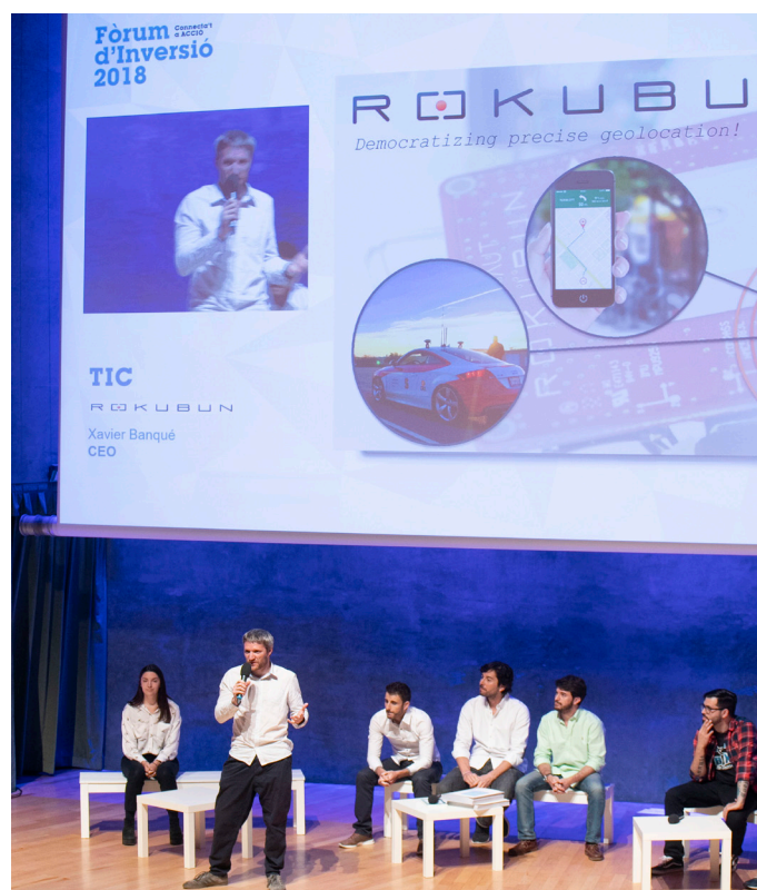
Fòrum d'inversió 2018.